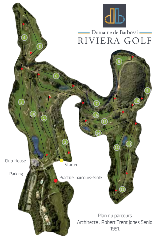
Plan du parcours. Architecte : Robert Trent Jones Senior 1991.

Toutes les distances sur les fairways sont exprimées en mètres à l'entrée du green. Pour le plaisir de tous les golfeurs, veuillez respecter les autres joueurs, le Commissaire du parcours et les règles universelles du Golf. Jouez vite, relevez les divots, ratissez les bunkers. Il est interdit de faire du practice sur le parcours et, surtout, d'utiliser les voitures sur les fairways lorsque leur interdiction est mentionnée.